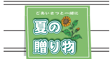
③ガーデックスシール例