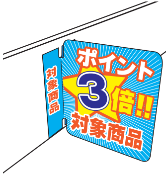
①シールスポッター

立体的な販促物やシール系販促物で、割引商品や人気商品、ポイント付与率の告知等を お客様にアピールできます。